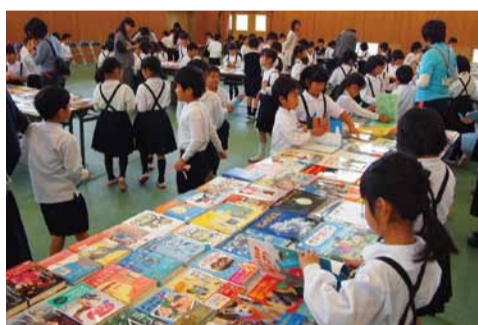
▲昼休みや業間休みの図書室は満員でした。