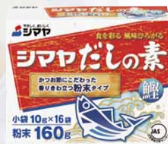
シマヤ だしの素 160g