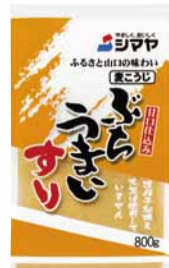
シマヤ ぶちうまいすり 800g